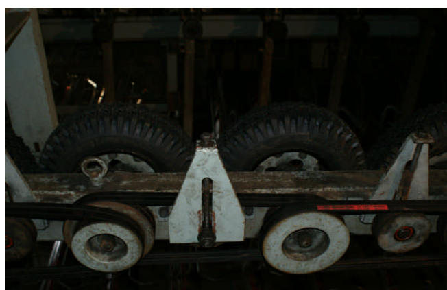
第3クワッド押送装置整備風景