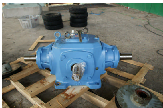
第3クワッド山頂 ベベルギヤボックス交換品