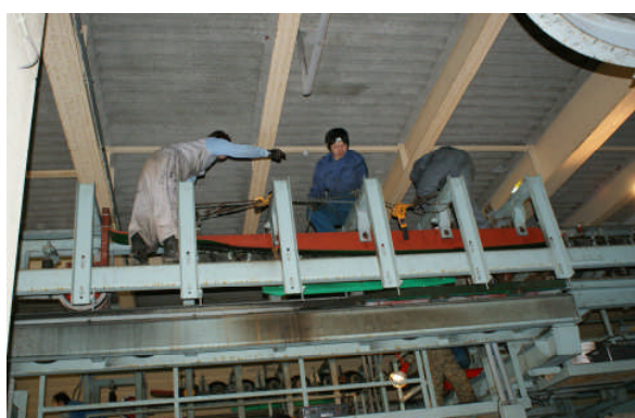
第3クワッド押送装置整備風景